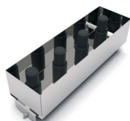
Zubehörcorb für Saugset